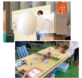
過去企画したイベントの様子

ショーや建設関係の企業様のリフォーム 祭りなどを行いました。今年も様々なイ ベントをお客様と企画していましたが、 コロナ禍ということで、全て中止になっ てしまいました。 現在は、コロナ収束後にイベントやその 他様々な企画をご提案できるよう、日々 色々なアイデアを蓄えています。こういった印刷物以外の案件に対しても ご提案させていただきますので、お気軽にご相談ください!