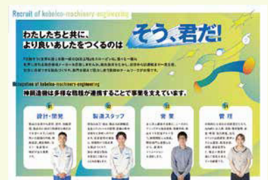
採用パンフレット