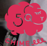
あれから50年が経っCHIMEeee~ました。